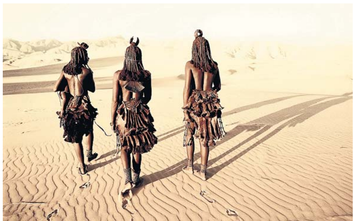
Het Himbavolk in Namibië.

Dat het einde van de laatste inheemse stammen er onherroepelijk aan komt, staat voor de Brits-Nederlandse fotograaf Jimmy Nelson vast. Drie jaar lang trok hij door 44 landen met maar één doel: de wereld laten zien hoe mooi ze zijn. Het resultaat bundelde hij in een boek.