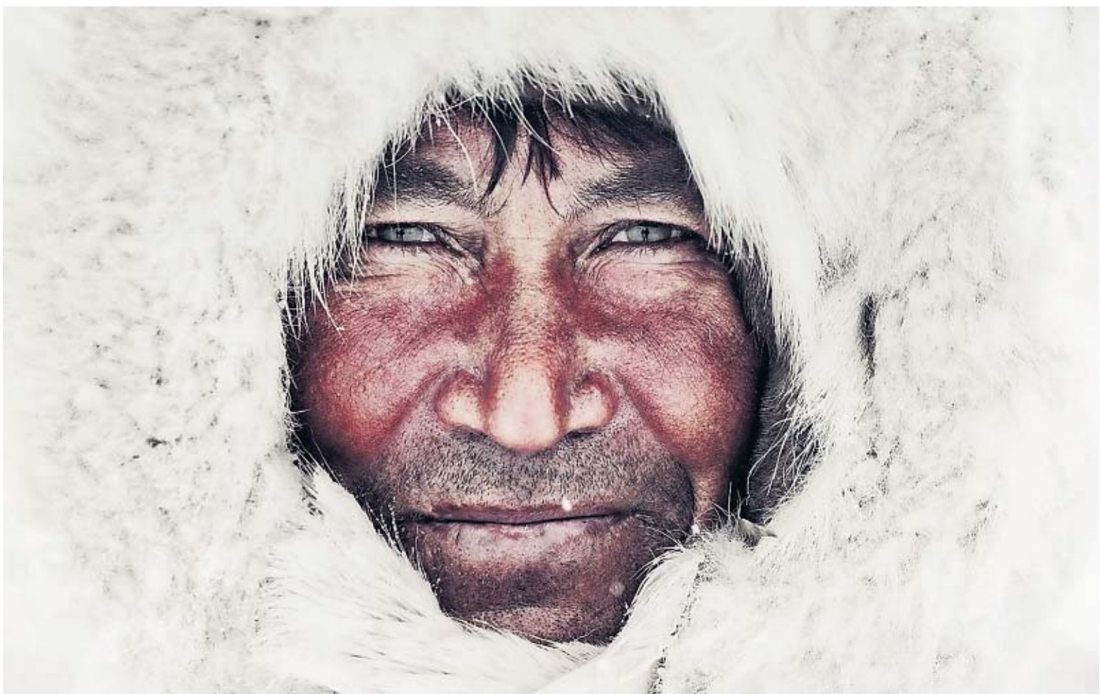
Een lid van de Nenets in Siberië.

Dat het einde van de laatste inheemse stammen er onherroepelijk aan komt, staat voor de Brits-Nederlandse fotograaf Jimmy Nelson vast. Drie jaar lang trok hij door 44 landen met maar één doel: de wereld laten zien hoe mooi ze zijn. Het resultaat bundelde hij in een boek.