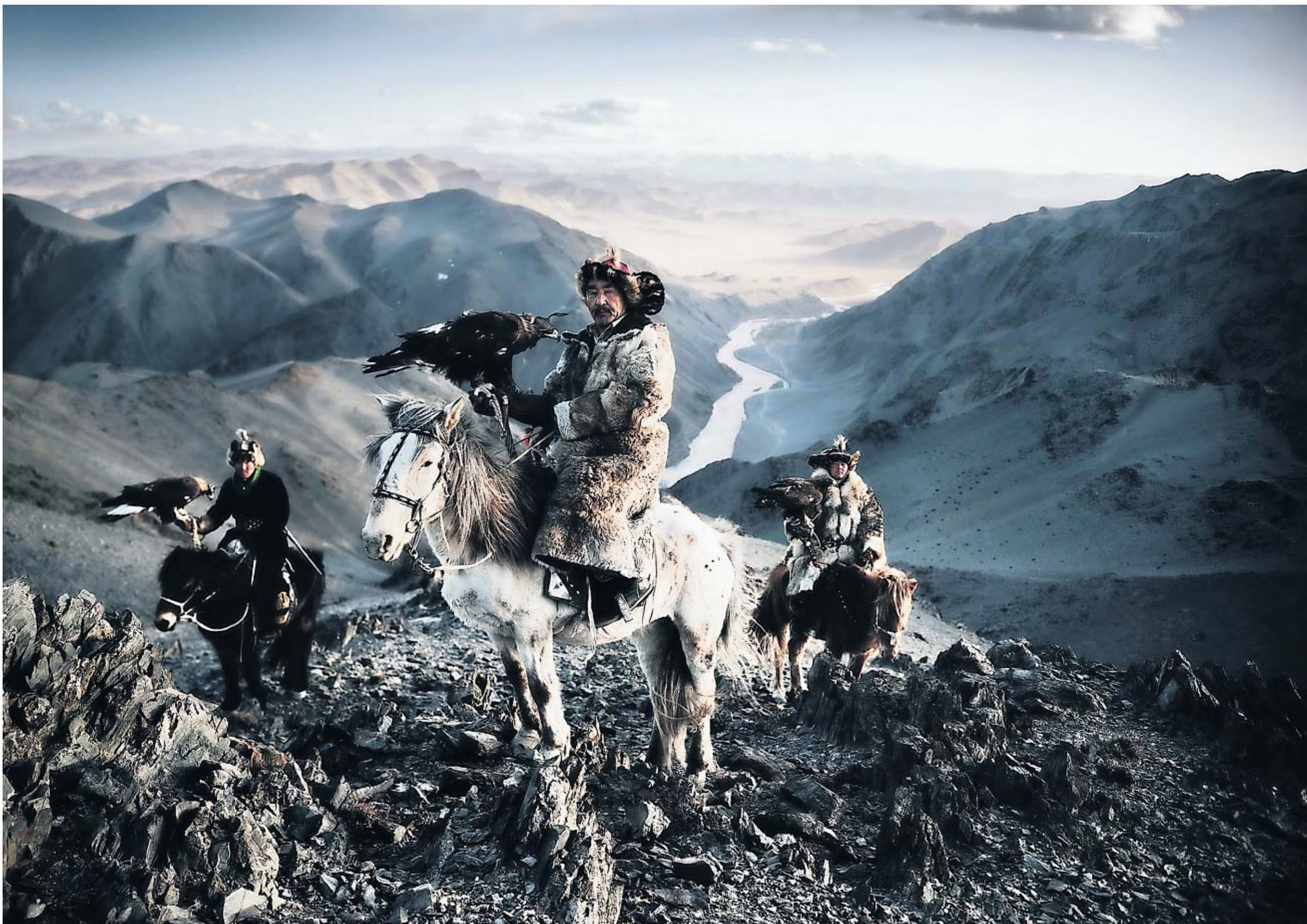
Trotse Kazakken in Mongolië, poserend met hun adelaar tijdens de jacht. Het is een van de vele tradities en vaardigheden die de Kazakken de laatste decennia hebben weten te behouden.