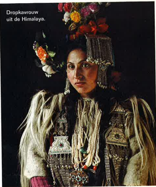
Dropkavrouw uit de Himalaya.