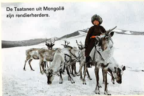
De Tsatanen uit Mongolië zijn rendierherders.

Before They Pass Away wordt uitgegeven door Tectum Publishers en verschijnt in maart 2013, maar u kunt nu al een exemplaar reserveren. Het boek wordt in een gelimiteerde XXL-versie van 250 stuks gedrukt, met boekenhouder en drie fotoprints, voor 5000 euro. Er is een ook versie met harde koft en doos, voor 1750 euro. Vanaf maart verschijnt ook een kleinere en goedkopere koffietafelversie, naast een film, dvd en computerspel. Info: www.tectum.be .